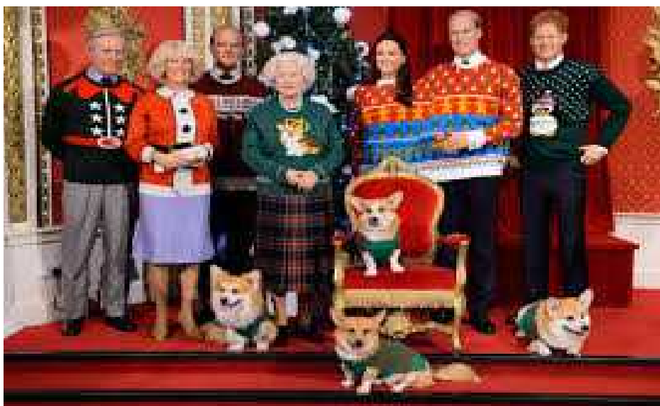
Une partie de l'équipe de co-secrétaires académiques de SUD EDUCATION 974

SUDEDITO Après la présentation de la réforme des retraites, comme on avait les boules, on les a accrochées dans le SUDKIFO, histoire de souhaiter un Noël bien pourri et une très mauvaise année à Jean-Manu, Jean-Edouard, Jean-Michel et Jean-Paul ainsi qu'à tous les gouvernements, en-marcheurs, matraqueurs, élémenteurs de langage , et en même temps à BFM, LCI, TF1 et France-Télévisions ; aux climatosceptiques, aux grévosceptiques, aux syndicaréformistes ; aux dysruptives, aux dysruptifs, aux premier-es de cordée, aux fossoyeurs du code du travail, de l'assurance chômage, de la sécurité sociale ; aux petit-es chef-fes qui abusent de leur petit pouvoir ; aux incinérateurs, aux boursicoteurs, aux liquidateurs ; aux évangélistes, aux intégristes, aux machistes ; aux actionnaires, au nucléaire, aux clauses du grand-père et bien entendu, à Tonton Abert.